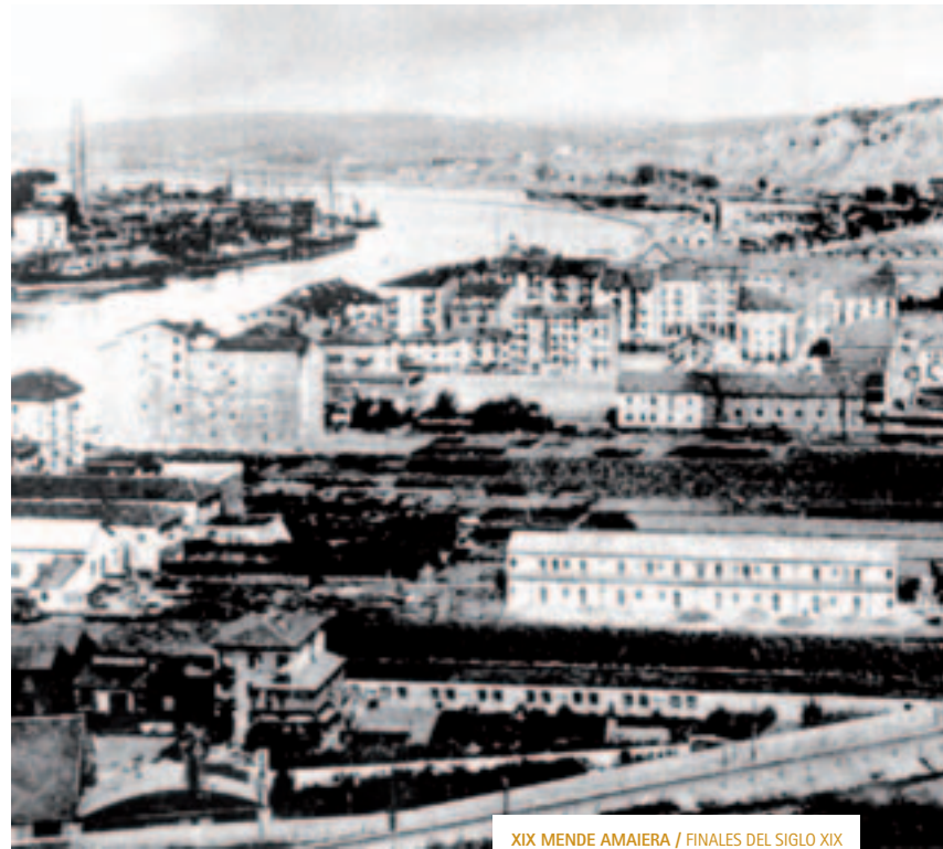
XIX MENDE AMAIERA / FINALES DEL SIGLO XIX

7 Debido a la extensión excesiva de algunos nombres, se ha decidido abreviarlos considerando la utilización actual y pretendiendo facilitar su uso en el futuro. Por ejemplo: Jado kalea, Benjamin anaia plaza, Ramón Sota erribera.